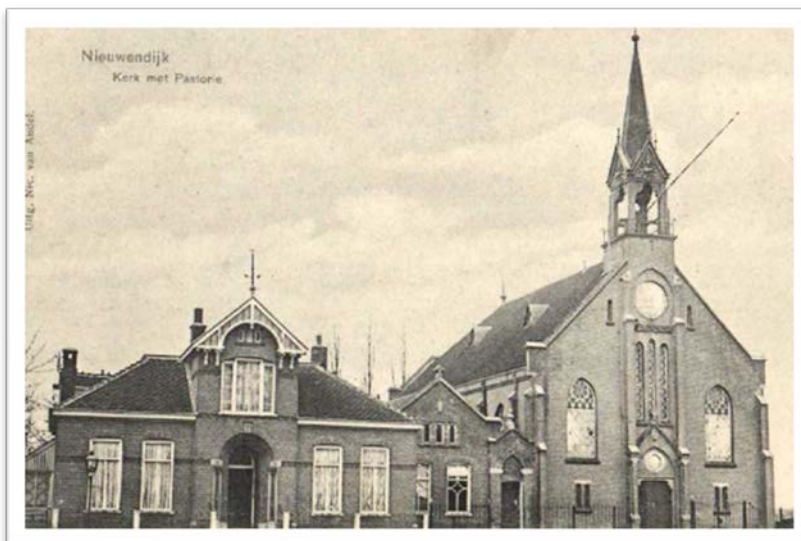
Kerk en pastorie in Nieuwendijk