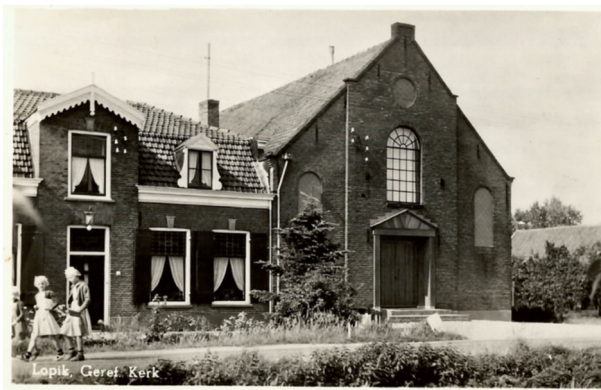
De gereformeerde kerk met pastorie aan de Fuikebrug, gebouwd in 1893.

Na de oprichting van de Gereformeerde Kerk Lopik was de eerste zorg het vinden van een geschikt kerkgebouw. Het kerkje van Kerk A was te klein. Kerk B beschikte niet over een eigen kerkgebouw. Men besloot daarom een nieuwe kerk te bouwen. De gemeenteleden gaven gul, zodat men relatief een klein deel van het geld voor de bouw hoefde te lenen. Een terrein hiervoor vond men aan de Lopikerweg Oost en al op 18 december 1893 werd de nieuwe kerk in gebruik genomen.