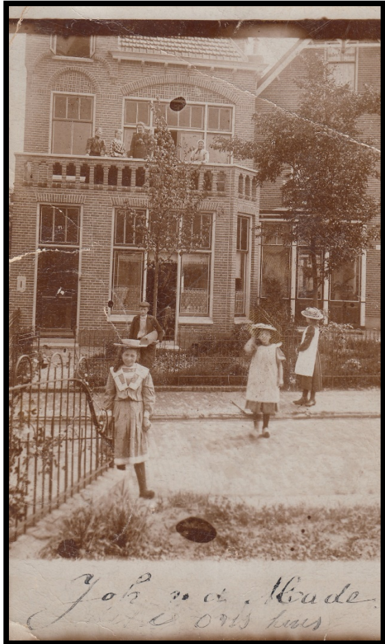
Haringkade 70 (1 ste woning)