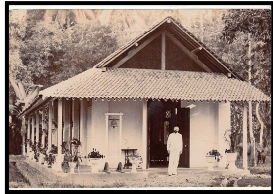
Kerk te Poerbollinggo